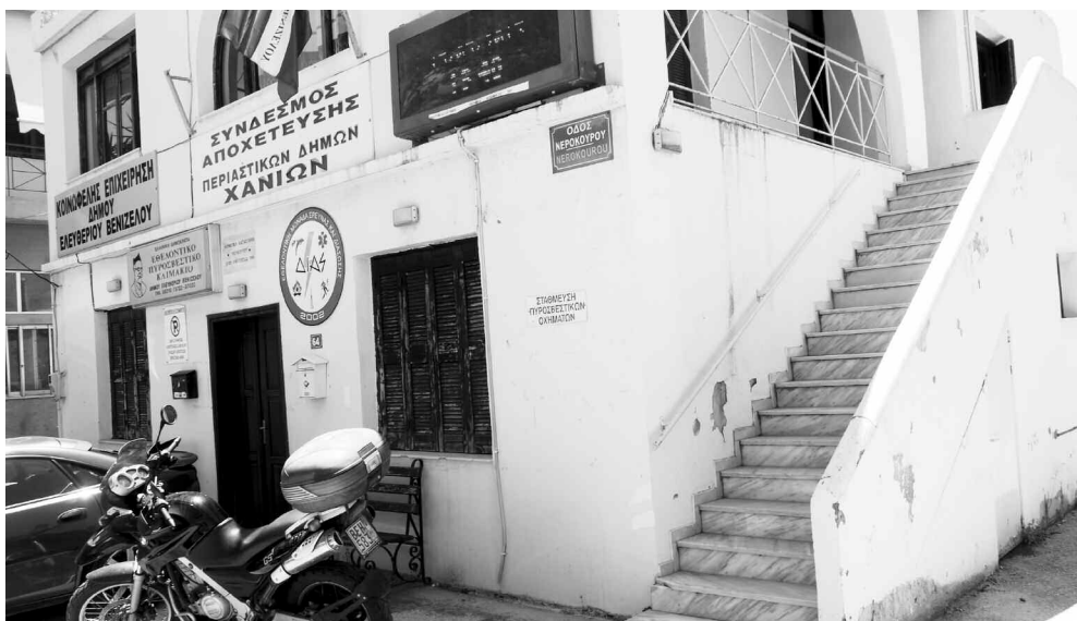
Στο ισόγειο του κτηρίου της Δημοτικής Κοινότητας Νεροκούρου θα εγκατασταθεί το δημοτικό κτηνιατρείο Χανίων.

Στη νομοθεσία επισημαίνεται πως τα αδέσποτα ζώα συντροφιάς που περισυλλέγονται οδηγούνται σε δημοτικά ή σε εξαιρετικές περιπτώσεις